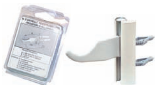
A027 mensole universali bianche - blister (coppia)