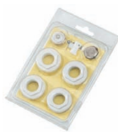
KIT RIDUZIONI CON GUARNIZIONI IN SILICONE E VALVOLA ORIENTABILE A043 3/8" per radiatori da 200/D a 800 mm - bianche o cromate A046 1/2" per radiatori da 200/D a 800 mm - bianche, cromate o colori speciali A048 3/4" per radiatori da 200/D a 800 mm - bianche o cromate