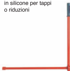
A079 leva per chiavi di montaggio A080 chiave di montaggio 500 mm A081 chiave di montaggio 800 mm