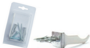
A029 mensole a squadra bianche - blister (coppia)