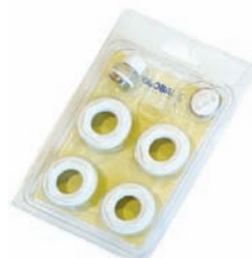
KIT RIDUZIONI CON GUARNIZIONI IN SILICONE E VALVOLA CON VOLANTINO A190 3/8" per radiatori da 200/D a 800 mm, bianche A192 1/2" per radiatori da 200/D a 800 mm, bianche