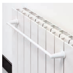
PORTASALVIETTE A201 48 cm bianco A202 48 cm cromato A207 32 cm bianco A208 32 cm cromato