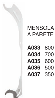
MENSOLA A PARETE