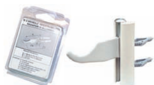
A027 mensole universali bianche - blister (coppia)