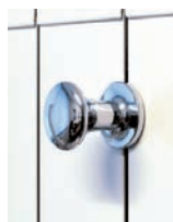
A237 appendino bianco A238 appendino cromato