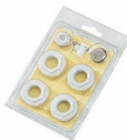
KIT RIDUZIONI CON GUARNIZIONI IN SILICONE E VALVOLA ORIENTABILE A043 3/8" per radiatori da 200/D a 800 mm - bianche o cromate A046 1/2" per radiatori da 200/D a 800 mm - bianche, cromate o colori speciali A048 3/4" per radiatori da 200/D a 800 mm - bianche o cromate