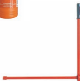
A079 leva per chiavi di montaggio A080 chiave di montaggio 500 mm A081 chiave di montaggio 800 mm