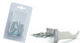
A029 mensole a squadra bianche - blister (coppia)